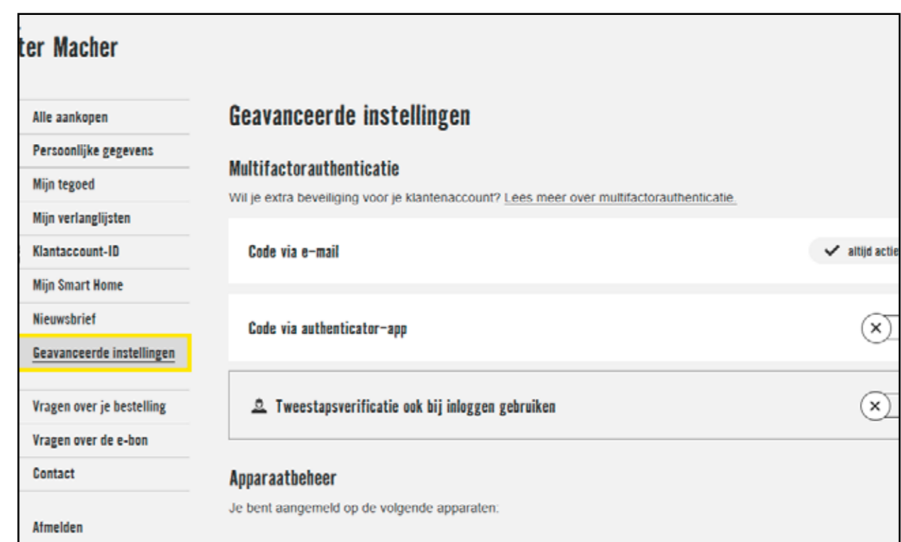
(1) Instellingen in het klantaccount

Stel je voor: je wilt geld bij een geldautomaat opnemen. Je gebruikt daarvoor je bankkaart (bezit) en je pincode (kennis). Dat is een voorbeeld van tweefactorauthenticatie, een type multifactorauthenticatie.